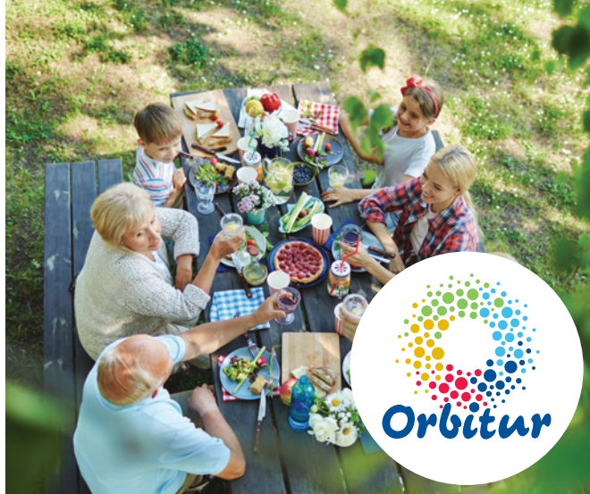
Tabela de Preços Price List (a) 2019