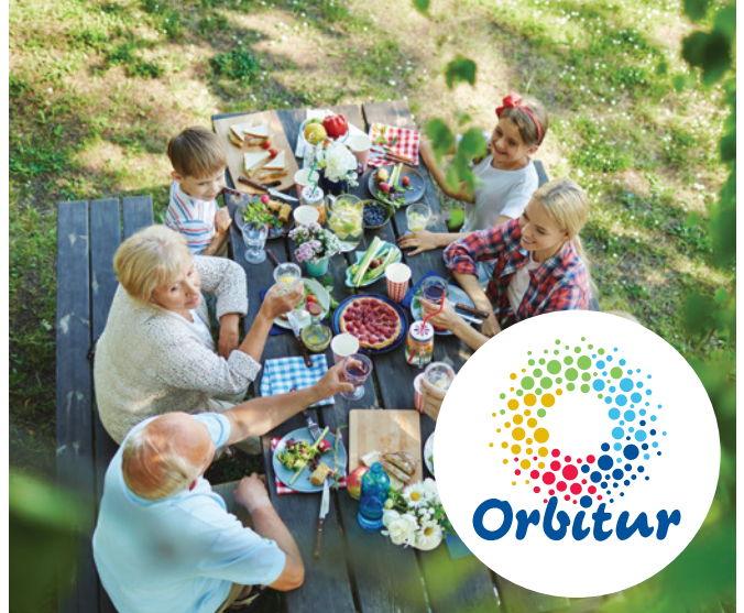
Tabela de Preços Price List (a) 2019