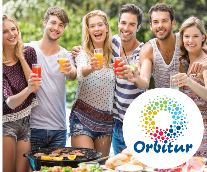
Tabela de Preços Price List (a) 2020