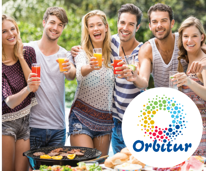
Tabela de Preços Price List (a) 2020