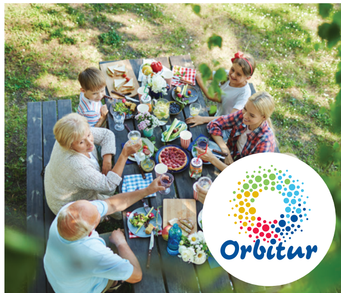
Tabela de Preços Price List (a) 2019