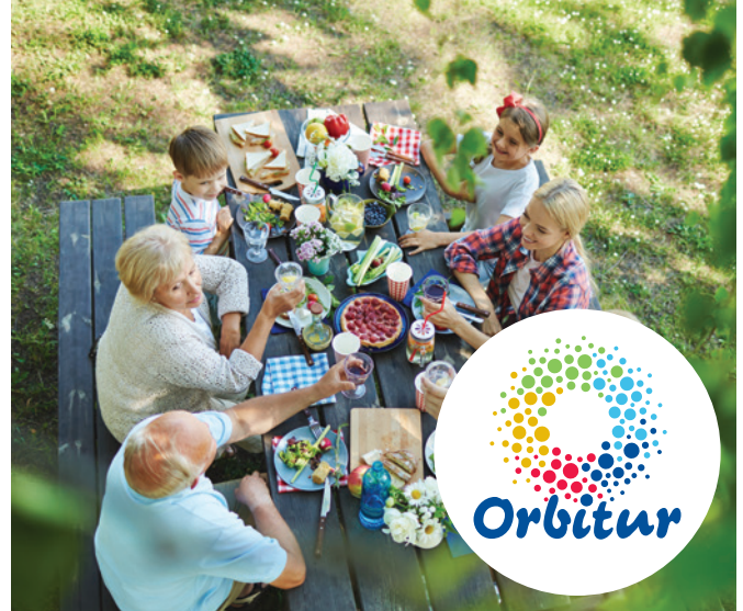
Tabela de Preços Price List (a) 2019