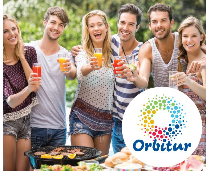
Tabela de Preços Price List (a) 2020